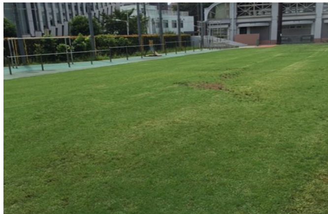
最新の写真（一番良いところです）

全面芝生化から6年、苦労は絶えません。最初の何年かは、芝生がはげる度に胃が痛くなりました。今では「また植えればいいよ」とスタッフの気持ちにも余裕が出来てきました。