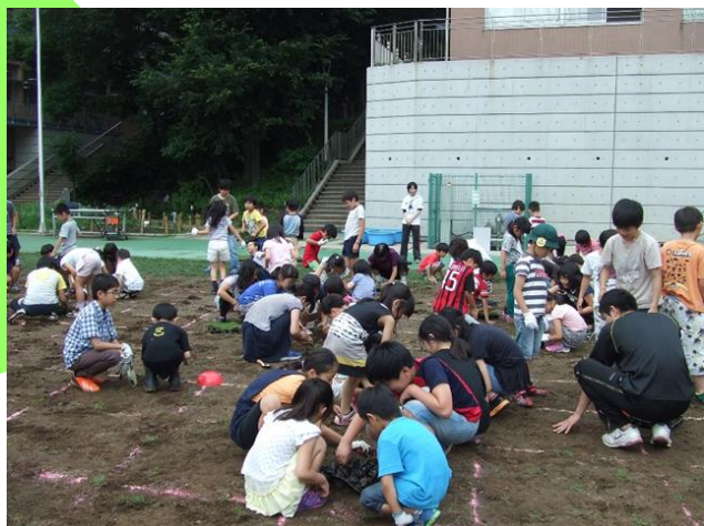
今年のポット苗植え

9年分の思いは、サイト http://minamiike.bhp.jp/ に詰め込んでいますので、ぜひ一度お訪ねください。